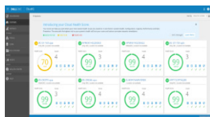
Score d'intégrité proactif